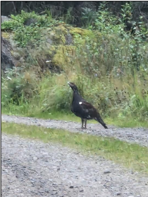
Kuva 8. Havaintopisteiden 1 ja 2 väliselle tielle oli tullut kolme metsoa, joista tässä toinen uroksista. Juhani Grönroos

Syksyjen 2023 ja 2024 maastoretkipäivinä ei lajista tehty havaintoja selvitysalueella. Tiira-tietokantaan (Tiira.fi) tehdyt kaksi kirjausta vuonna 2023 ovat alueen itäpuolelta. Sääksien pesät ja ruokailualueet ovat läheisten järvien alueella, eikä niillä ole tarvetta lentää selvitysalueen yli merelle.