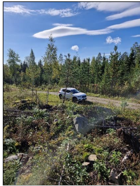
Kuva 5. Maisema lounaaseen havaintopisteeltä 3. Juhani Grönroos