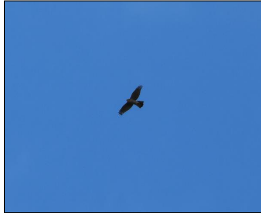
Kuva 7. Kanahaukka kiertelemässä havaintopisteen 5 yläpuolella. Juhani Grönroos

Syksyn 2024 kolmena maastoretkipäivänä ei lajista tehty havaintoja selvitysalueella, mutta havaintopisteellä 5, alueen ulkopuolella, havaittiin lajin yksilö kiertelemässä (kuva 7. ). Tiira-tietokantaan (Tiira.fi) oli tallennettu yksi paikallinen havainto selvitysalueelta, kuten vuoden 2023 selvityksessä.