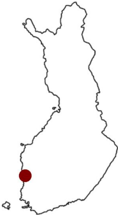
Kuva 1. Hankealueen sijainti.

A. Ahlström Osakeyhtiön ja Satawind Oy:n suunnittelema 6,5 neliökilometrin tuulivoimapuistoalue sijaitsee Porin Ahlaisten Lampin alueella, Porista n. 25 km pohjoiseen ja 2,5 km Ahlaisten taajamasta koilliseen. Alueen ympäristöä ja luonto-olosuhteita on kuvattu ja arvioitu tuulivoimahankkeen ympäristövaikutusten arviointiselostuksessa vuodelta 2015.