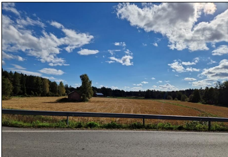
Kuva 6. Maisema itään selvitysalueen suuntaan havaintopisteeltä 5. Juhani Grönroos

Olosuhteet havaintojen tekemiseen olivat hyvät. Ensimmäisenä havaintoretkipäivänä 24.8. klo 17.00–20.00, lämpötila 18 astetta, pilvisyys 20% ja tuulen voimakkuus 6 m/s. Toisena retkipäivänä, 25.8. klo 9.30–13.30, sää oli pilvipoutainen (80%), lämpötila 21 astetta ja tuulen voimakkuus 8 m/s. Kolmantena havaintopäivänä 11.9. klo 9.30–13.30, lämpötila oli 15 astetta, taivas lähes pilvetön ja tuuli 4m/s.