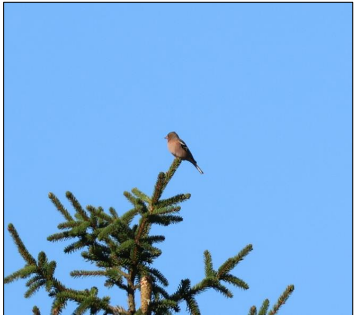
Kuva 9. Peippoparvia esiintyi runsaasti, tämä yksilö istui kuusen latvassa havaintopisteen 1 lähistöllä.

Tuulihaukka ( Falco tinnunculus ), nuolihaukka ( Falco subbuteo ) ja ampuhaukka ( Falco columbarius ) todettiin vuoden 2014 kaakkuri- ja petolintuseurannassa täysin satunnaisiksi läpilentäjiksi. Syksyjen 2023 ja 2024 maastoretkipäivinä ei lajeista tehty havaintoja selvitysalueella ja Tiira-tietokannan (Tiira.fi) harvat havainnot tukevat tätä oletusta edelleen. Muut päiväpetolintulajit eivät ole levinneisyydeltään selvitysalueelle tyypillisiä, eikä niitä syksyn havaintoretkillä myöskään tavattu.